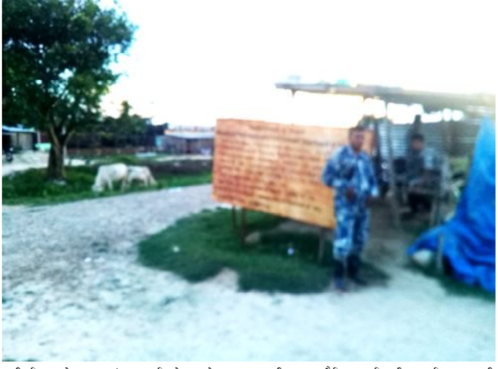
पारी विहारको अन्धरामठ र वारि नेपालको सशस्त्र प्रहरी बल बनैनियामा डियुटीमा खटिएका प्रहरी जवानहरू।

दैनिक समाचारदाता राजविराज, १ भदौ। सप्तरीको बनैनियाँ नाकाबाट लकडाउनको मौका छोपेर राती राती अबैध मालसमानहरू ओसारपोसार हुने गरेको खुलासा भएको छ।